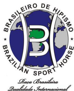
Tabela de Julgamento Morfologia